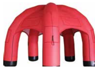
ca. 5 m