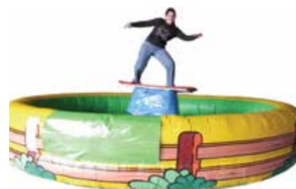
ca. 5 m