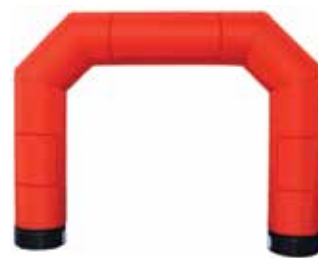
ca. 3,9 m

*bei normaler Verschmutzung, zusätzlicher Reinigungsaufwand wird separat in Rechnung gestellt