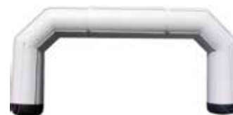
ca. 12 m