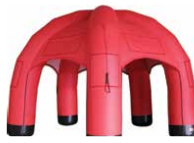
ca. 5 m