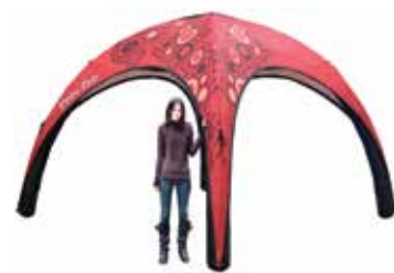
ca. 4 m

*bei normaler Verschmutzung, zusätzlicher Reinigungsaufwand wird separat in Rechnung gestellt