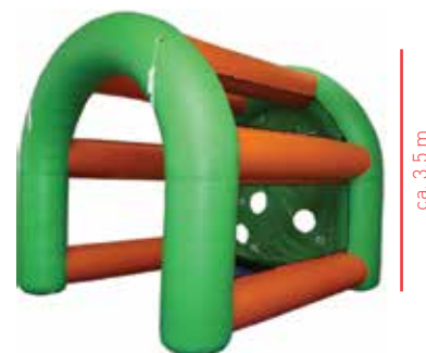
ca. 3,5 m

- Dieses Action Game wird nur mit Eventpersonal von no problaim vermietet (siehe Seite 25).