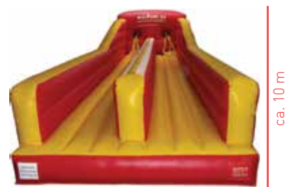
ca. 10 m