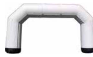
ca. 10 m