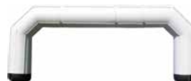
ca. 14 m