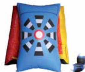
ca. 2,4 m

*bei normaler Verschmutzung, zusätzlicher Reinigungsaufwand wird separat in Rechnung gestellt