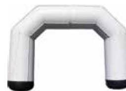
ca. 8 m