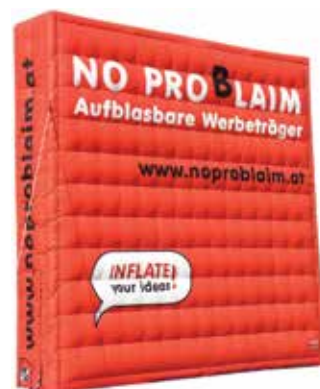
ca. 5 m