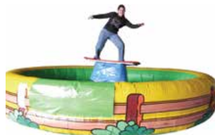
ca. 5 m