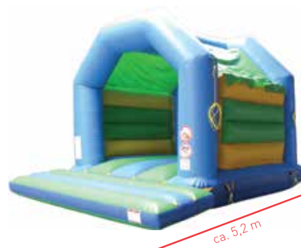
ca. 5,2 m

*bei normaler Verschmutzung, zusätzlicher Reinigungsaufwand wird separat in Rechnung gestellt