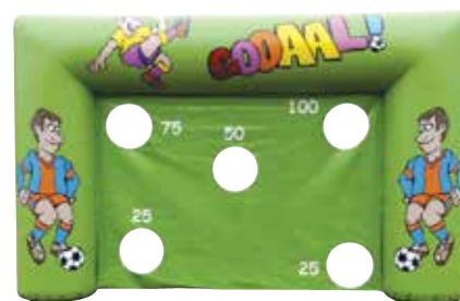
ca. 4 m