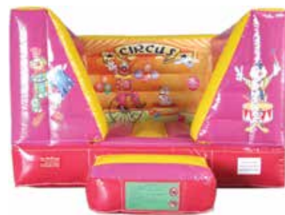
ca. 3 m