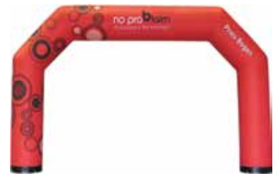
ca. 8 m

*bei normaler Verschmutzung, zusätzlicher Reinigungsaufwand wird separat in Rechnung gestellt