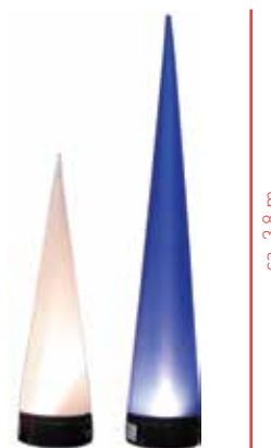
2 Stück 6 Stück

*bei normaler Verschmutzung, zusätzlicher Reinigungsaufwand wird separat in Rechnung gestellt