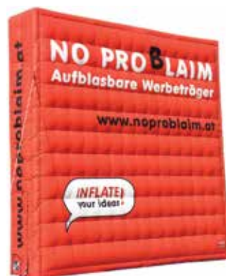
ca. 5 m